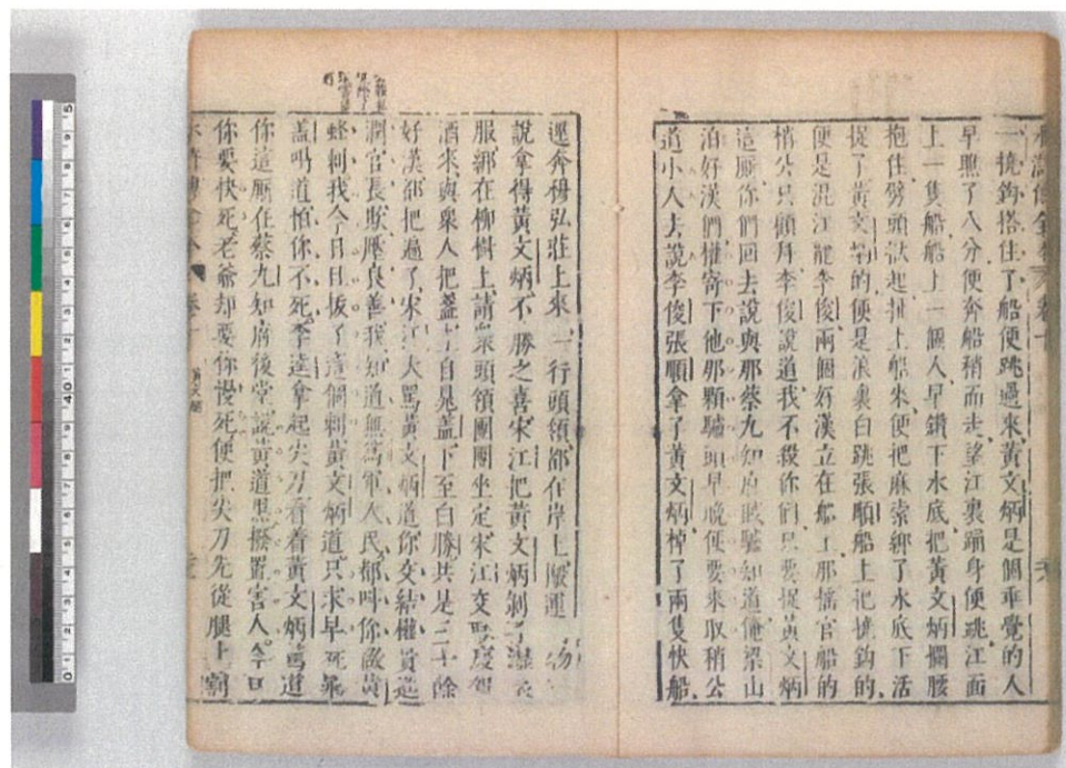
同書 第十卷第二十八葉裏と第二十九葉表